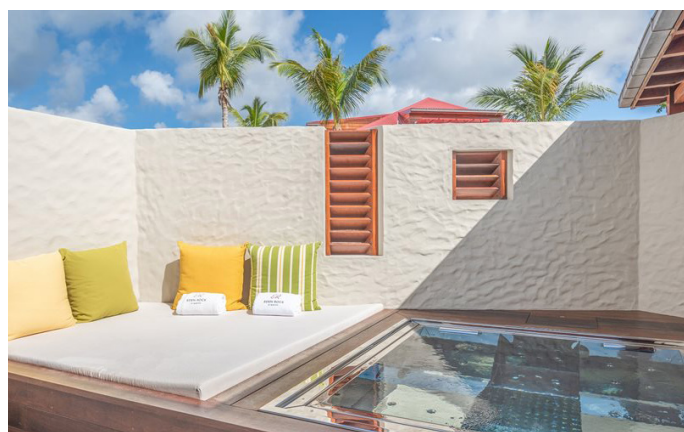
Diamond Suite Waterlily Eden Rock, Saint Barthélémy |

Nos spas inox s'imaginent dans tous types de paysages et d'intérieurs, en usage professionnel ou particulier. Ils vous garantissent la modernité, l'esthétique, le confort, l'aspect hygiénique et la durabilité. Nous allions cette superbe finition à notre système de traitement d'eau UBO ultra-performant, vous permettant d'obtenir quotidiennement une eau saine et cristalline. Le système UBO repose sur une filtration ultrafine de 1 micron grâce à un média filtrant ionisé et un traitement bactériologique unique à l'ozone et aux UVs.